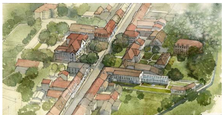
(Entwurf City Campus Karl-Friedrich-Gymnasium)

Gegenüber diesem kleinen Barockschloss befindet sich mit dem ehemaligen Gymnasium der Stadt Emmendingen, der Karl-Friedrich-Schule, der Kern des vierten untersuchten Standortes. In der Voruntersuchungsphase wurde an diesem Beispiel die Idee eines auf mehrere Gebäude über die Stadt verteilten City Campus entwickelt. Lehrstehende Gebäude in unmittelbarer Nachbarschaft bildeten die Grundlage für zunächst vier Varianten, die schließlich in dem letzten Entwurf bildlich zusammengefasst wurden.