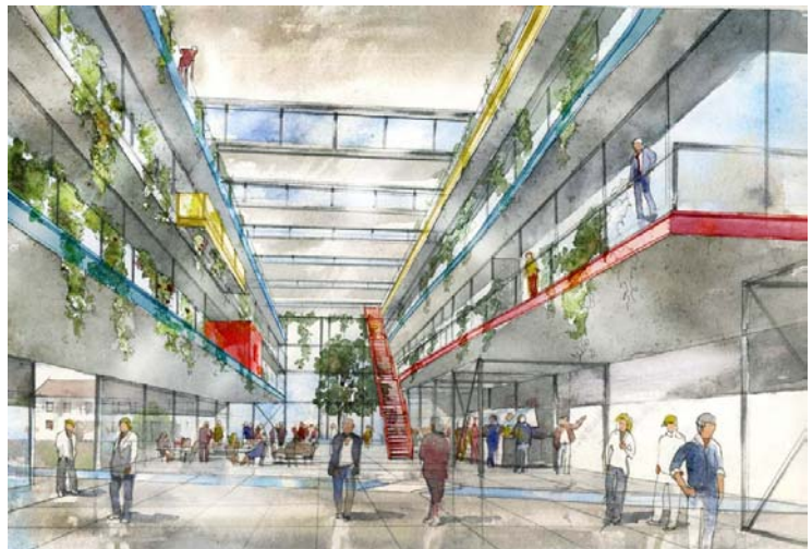
(Entwurf City Campus Wehrle Werk)

Die anschließende Besichtigung des Werksgeländes verdeutlichte die historische Bedeutung des Werkes für die stadträumliche Entwicklung und führte zu einer recht lebhaften Diskussion über die Möglichkeiten, auch zukünftig diese innenstadtnahe Lage zu erhalten, zumal sich das Unternehmen in den letzten Jahren zunehmend auf konstruktive Tätigkeiten und die Planung von umwelttechnischen Anlagen fokussierte. Kritisch wurde diskutiert, inwieweit die traditionelle Verlagerung in am Stadtrand gelegene Gewerbegebiete dem Leitgedanken der urbanen Stadt nicht grundsätzlich zuwiderlaufe. Beispiele wie Poundbury zeigten ja gerade, dass die Ansiedlung mittelständischer Produktionsbetriebe dem Gedanken der Urbanität nicht widerspräche, sondern eben erzwungene Mobilität vermeide und damit deutlich zur Attraktivität einer Stadt beitrage.