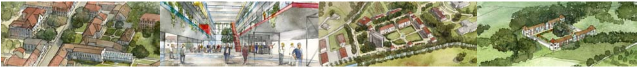
Standorte der Hochschule der Humanökologie in Emmendingen

beteiligt waren. Die Ergebnisse wurden, wie aus der Presse ersichtlich, überaus positiv aufgenommen und bilden nun den Grundstein für die weitere Entwicklung. Zwei Projektschwerpunkte sollen die Lehre und Forschung an einer künftigen Hochschule der Humanökologie in Emmendingen prägen. Einer davon – Future Urban Culture – wird sich dezidiert mit der energetischen Modernisierung der europäischen Stadt auseinandersetzen und damit ein zentrales Thema des CEUD aufgreifen. Eine Hochschule der Humanökologie in Emmendingen könnte damit auch ein wichtiges Zentrum der künftigen Entwicklung des CEUD werden.