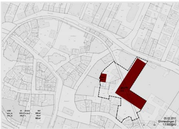
Der Alte Markt (unten links von der Mitte) und das untersuchte Teilgelände des Wehrle Werkes (rot)

Das Wehrle Werk, Ende des 19. Jahrhunderts als Kesselbauer-Werkstatt direkt am Rand des alten Marktplatzes entstanden, beherrscht heute mit seinen Hallen den südöstlichen Rand des historischen Zentrums. Aus Sicht der Stadtplanung würde man an Stelle der Werkshallen gerne eine andere Entwicklung und Flächennutzung sehen. Insofern bildete die Teilkonversion des nördlichen Hallenblocks (in der Karte rot markiert) zur Hochschule eine reizvolle Perspektive. Nicht nur, dass durch den Abriss des überflüssigen Heizhauses ein zweiter, zum Alten Markt korrespondierender öffentlicher Platz vor dem Hochschulgebäude entstünde, auch die offene und transparente Fassade sowie die Wiederöffnung des Mühlbachs, der sodann das Hochschulgebäude durchfließen würde, könnten das gesamte Stadtbild bereichern.