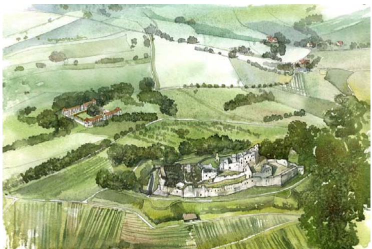
(Entwurf Internats Campus Domäne Hochburg)

Der dritte Standort, die Domäne unterhalb der Hochburg Emmendingen, ist am weitesten außerhalb gelegen. Seit dem frühen 19. Jahrhundert war sie ein Zentrum der landwirtschaftlichen Ausbildung. Überlegungen des Landes Baden-Württemberg und des Landkreises im Jahr 2009, diesen Standort zu schließen, waren ein entscheidender Anlass, über diesen Standort für einen Internats Campus nachzudenken, zumal hier ganz ohne Zweifel der Bezug zu dem genannten zweiten Schwerpunkt unmittelbar auf der Hand liegt. Mittlerweile ist die Entscheidung gefallen, den Standort beizubehalten. Damit entfällt eine unmittelbare Nutzung für einen Internats Campus, wie noch auf der Charette vorgesehen. Gleichwohl wurde aber empfohlen, die Möglichkeiten einer Kooperation zu klären.